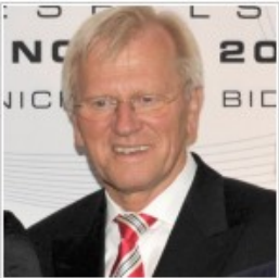
Ο πρόεδρος της Ένωσης Ταμιευτηρίων Γερμανίας, Χάινριχ Χάζις, ανησυχεί ότι με την επιβολή του ειδικού τραπεζικού φόρου τα ιδρύματα θα προβαίνουν σε πιο επικίνδυνες συναλλαγές.